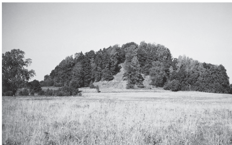
2. att. Kūliņu pilskalns

Ārstnieciskie jeb veselības avoti. Kā rāda savāktais materiāls, daudz lielāka nozīme Augšzemes avotiem bija kā dziedināšanās vietām jeb kā veselības avotiem. Materiāls par Latvijas veselības avotiem ir apkopots jau 1986. g., 8 tomēr laika gaitā tas ir jūtami papildinājies. Šī veida avoti parasti nav tieši saistīti ar pilskalniem, tomēr nebūtu noliedzams, ka arī veselības avotu nozīmei bija jābūt zināmai jau ļoti senā pagātnē. Izņēmums te ir uz pašas Latvijas un Lietuvas robežas savdabīgais Rītes Petruku pilskalns, ko Latvijas pusē sauc par Karātavu kalnu 9 (lietuviešu pētnieki šo pieminekli dēvē par Ažubaļu pilskalnu 10 ). Pie pilskalna atradies Māras akmens, no kura apakšas iztecējis avotiņš, kas apkārtnē skaitījies kā svētavots. Akmens un avota tuvumā atrastas senlietas 11 .