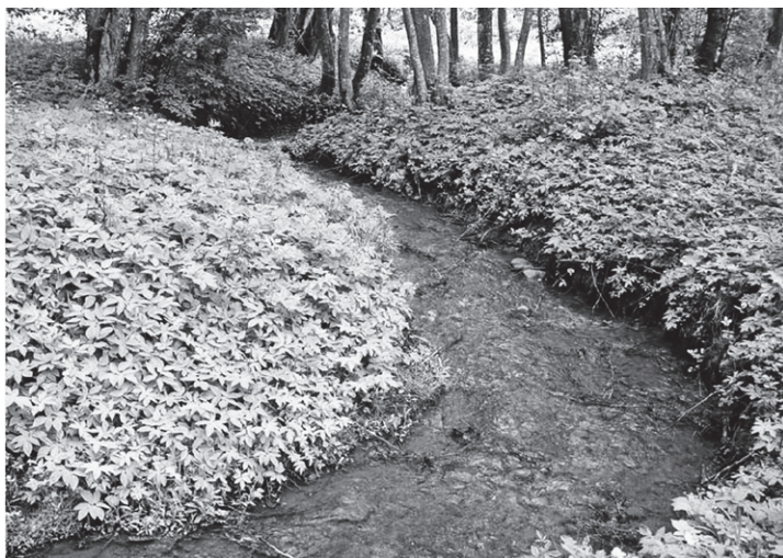
3. att. Aknīstes Saltupe

Ar dziedniecību un ar dziedniecības folkloru ir saistīti 12 no Augšzemes teiku un nostāstu avotiem. Par avotu dziedniecisko nozīmi liecina arī šo avotu īpašais nosaukums — Veselības avots Subatē, 12 Saliēnā, 13 Sēlpilī, 14 Acu avots Lašu Kalnišķos / Cielavās. 15 Visbiežāk ar avota ūdeni ārstēja acu slimības. Par veselības avotiem ir fiksēts samērā daudz nostāstu. Piem., par avotu pie Subates stāstīts: “[...] Toreiz tur bija divi dakteri. Avotiņš bija pie viena daktera. Kad abi saplēsās, pirmais vairs otrajam ūdeni nedeava, aizslēdza avotiņu ar vāku. Bet kādu nakti vāks bija izlauzts. Tad dakteris uztaisīja virsū tādu kā skapi un durvis aizslēdza. Uz slimnīcu apkopēja katru dienu nesa divi nēši. Tēvam roka nedzija, nedzija, bet tad sāka mazgāt ar avota ūdeni, piepilināja tik drusku karbola, un roka sadzija 16 .”