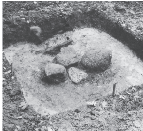
4. att. Arheoloģiskajos izrakumos atraktā Sēlpils Baltiņu Svētavota vieta

iegūst orientiera jeb ainavas marķiera lomu. Avota nosaukums, kas apliecina kādreizējo avota nozīmību ir, piem., Bebreņu Arestantu avots: “Lielceļa malā 4 verstis no Bebreņu uz Jelgavas pusi. Teika stāsta: Senos laikos dzinūši pa lielceļu arestantus. Bijušas vairākas vietas, kur tie atpūtušies. Viena no šādām vietām ir bijuse minētais avots. Tur arestanti atpūtināti un dzirdināti. No tā avots arī dabūjis savu nosaukumu “Arestantu avots” 26 .” Spriežot pēc nosaukuma, ar kaut kādām tagad zudušām tradīcijām saistās Seces Brunavas Pīpes avots 27 . Tāpat zīmīgi ir stāstījumi par avotos nogrimušo naudu, kas parasti saistās ar daudz senāku mitoloģisko slāni par apslēpto mantu, tās mitiskajiem sargiem, par noteikumiem un to izpildīšanu vai neizpildīšanu, lai varētu nesodīts dabūt mantu 28 . Folkloras tekstā par Lones avotu teikts: “Saukas pagastā pie Lones kapu kalna ir mazs avotiņš. Viens ogļu dedzinātājs reiz noskatījies, ka ap pusnakti pie minētā avotiņa kuroties uguns. Vienu nakti, kad uguniņa atkal spīdējusi, tas gājis skatīties, kas tur ir. Piegājis klāt un ieraudzījis avotiņa malā lielu mucu. Piepēži tas izdzirdis balsi: “Aiztiec mani! Aiztiec mani!” Saucēja nevarējis saskatīt. Balss atkārtojās trīs reizes. Tad viens teicis: “Simtu gadu